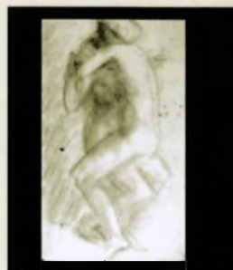
Auguste Rodin, 1900.

En esta obra el cogito mismo no sale indemne de ese retorno imprevisto del amor en la filosofía. Marion no cuestiona que la experiencia del cogito ofrezca al sujeto una certeza, aunque sea temporalmente puntual. Pero su pregunta “¿para qué sirve?” por la cual introduce el amor, es en efecto devastadora.